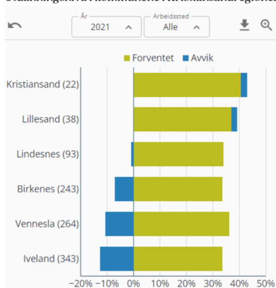
Figur 5.1.4 Faktisk utdanningsnivå som summen av forventet utdanningsnivå ut fra arbeidsmarkedet og avviket fra forventet utdanningsnivå.

Kristiansand og Lillesand har et høyere utdanningsnivå enn de andre kommunene i regionen. Det kommer dels av at arbeidsmarkedet i disse to kommunene etterspør høyt utdannet arbeidskraft i stor grad slik at det blir et forventet høye utdanningsnivå i befolkningen. Kristiansand og Lillesand har i tillegg høyere utdanningsnivå fordi de har mange med høy utdanning boende i kommunene som pendler ut. Det tyder på at disse to kommunene er attraktive som bosteder for folk med høyere utdanning.